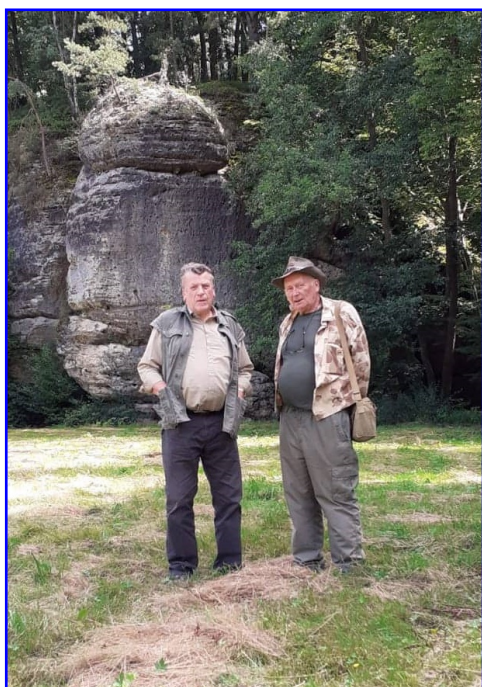
Pod Psí skálou už srub nestojí