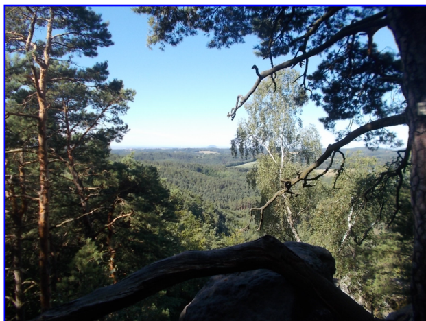
Zámek Houska - nádvoří Housecká vyhlídka