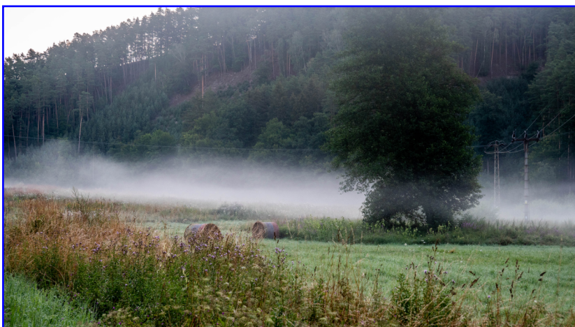
Ranní pohled od stanu