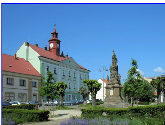
Dubá - náměstí